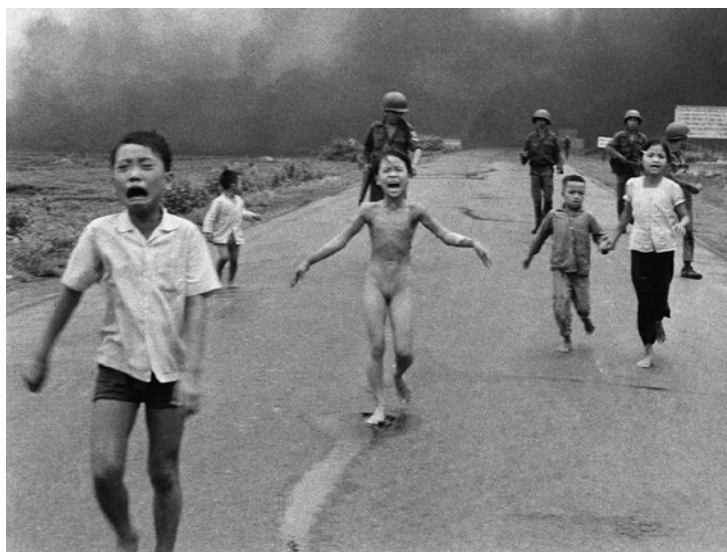
en 1972, en Vietnam durante un bombardeo con Napalm.

Existirán la duda de confiar y el temor a la repetición de la pérdida, y el dolor, y se evadirá iniciar nuevos vínculos o restablecer anteriores. Es lo que vemos en el reencuentro de niños separados de sus padres por tiempo considerable. Los padres, emocionados, se abrazan tenazmente a sus hijos, mientras ellos responden tímidos y fríos, sin mostrar apego. Posiblemente internalizan la pérdida como abandono.