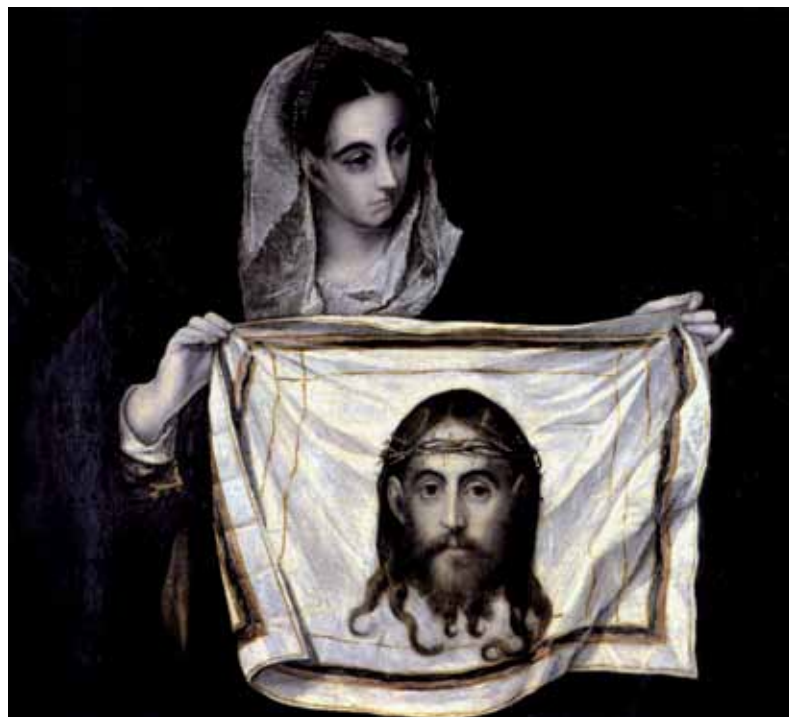
El Greco, aprox. 1580, “Santa Verónica con el velo”, óleo sobre lienzo 84 cm x 91 cm, Museo de Santa Cruz, Toledo.