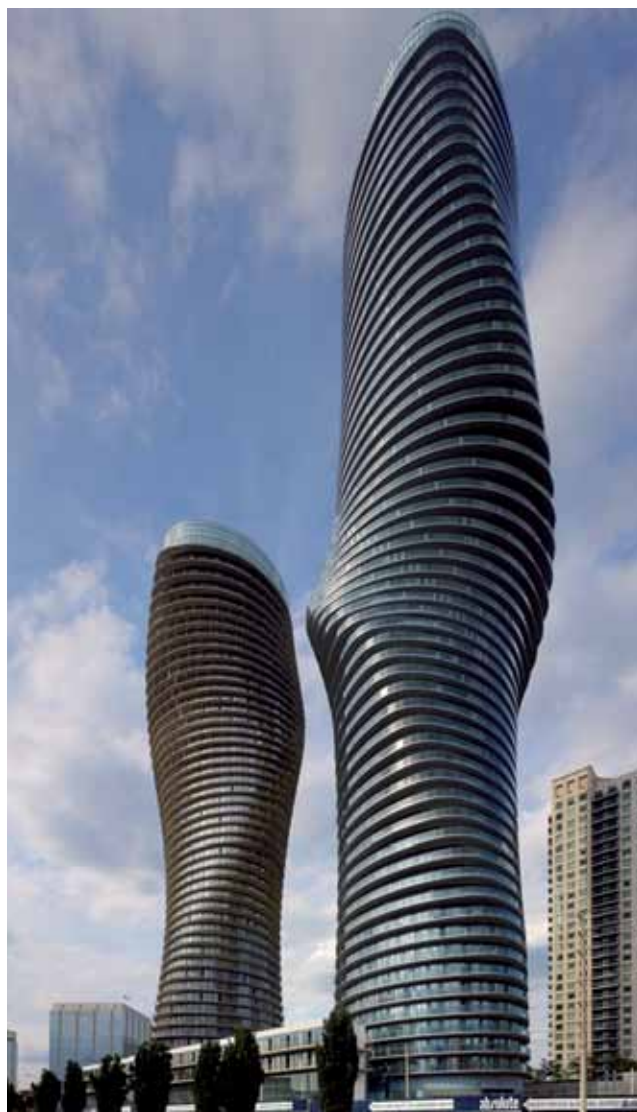
Absolute Towers, Mississauga, Canada.