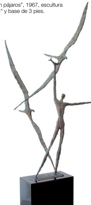
Lindsay Daen, "Joven con pájaros", 1967, escultura en bronce, 64" x 34" x 14" y base de 3 pies.